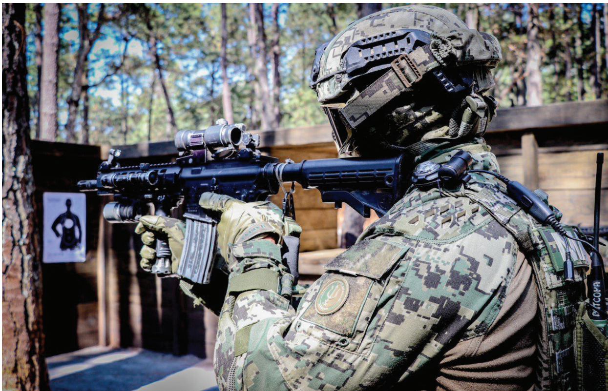
Fotografía 14. Infante de Marina