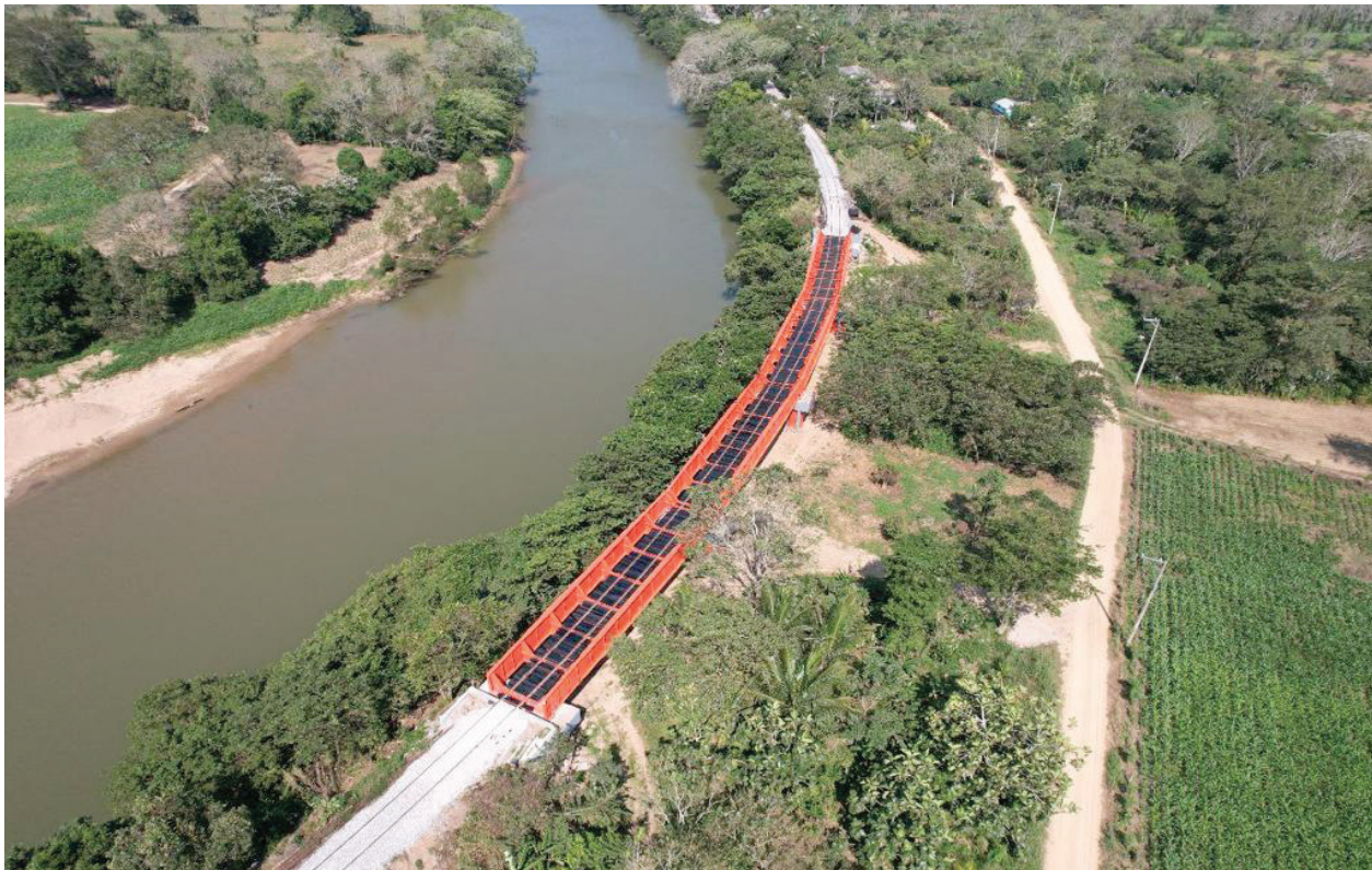
Fotografía 42. Línea ZA del FIT.