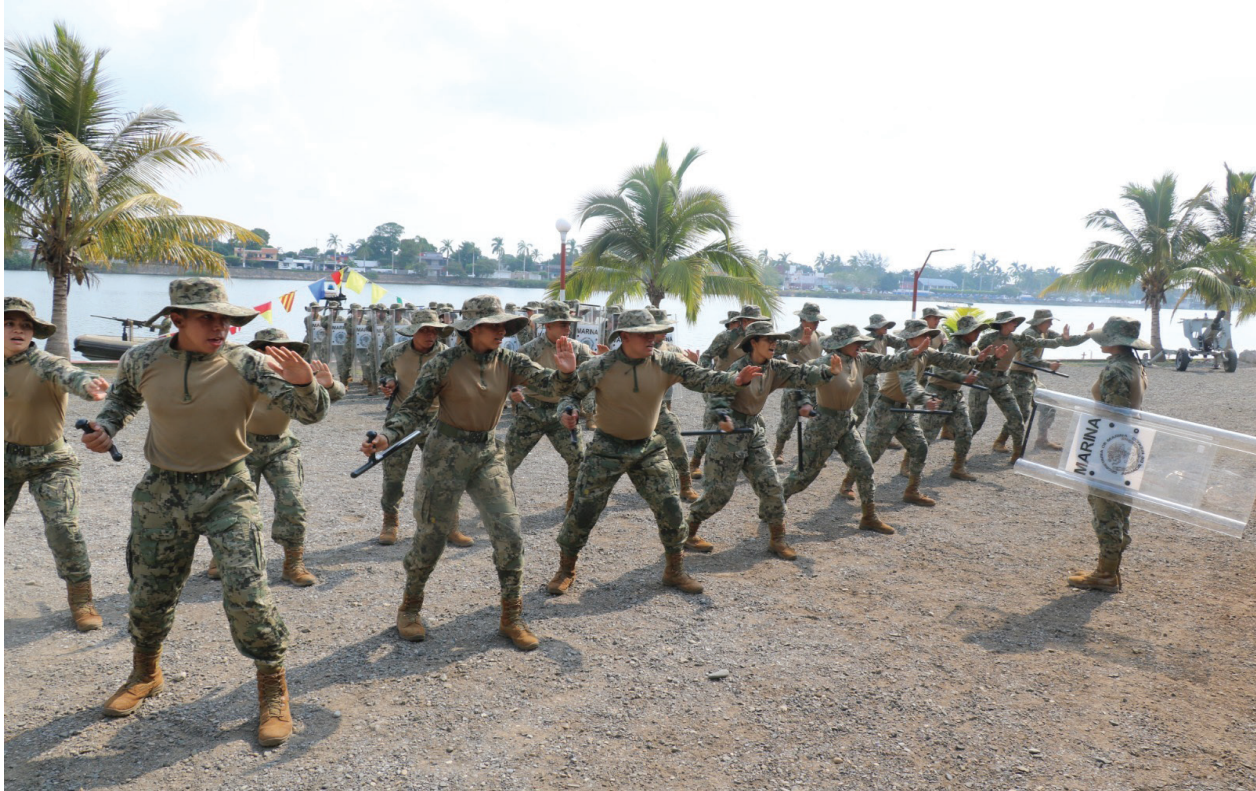
Fotografía 21. Curso Formación Inicial Policial.