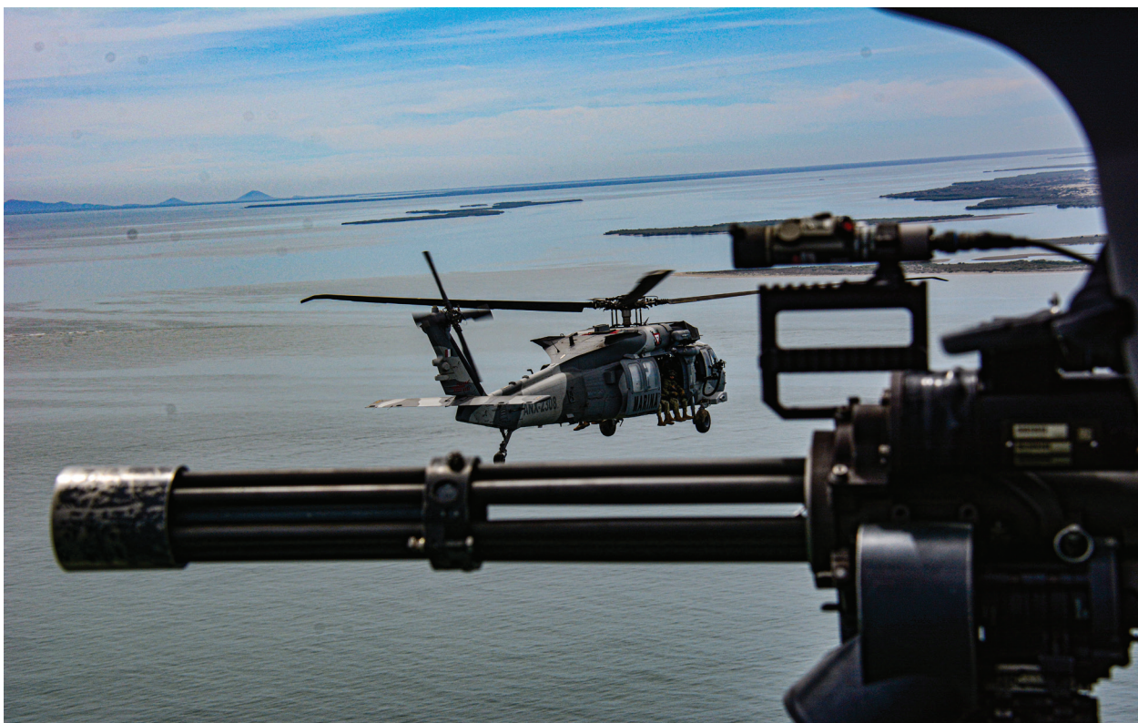
Fotografía 13. Seguridad Aérea.