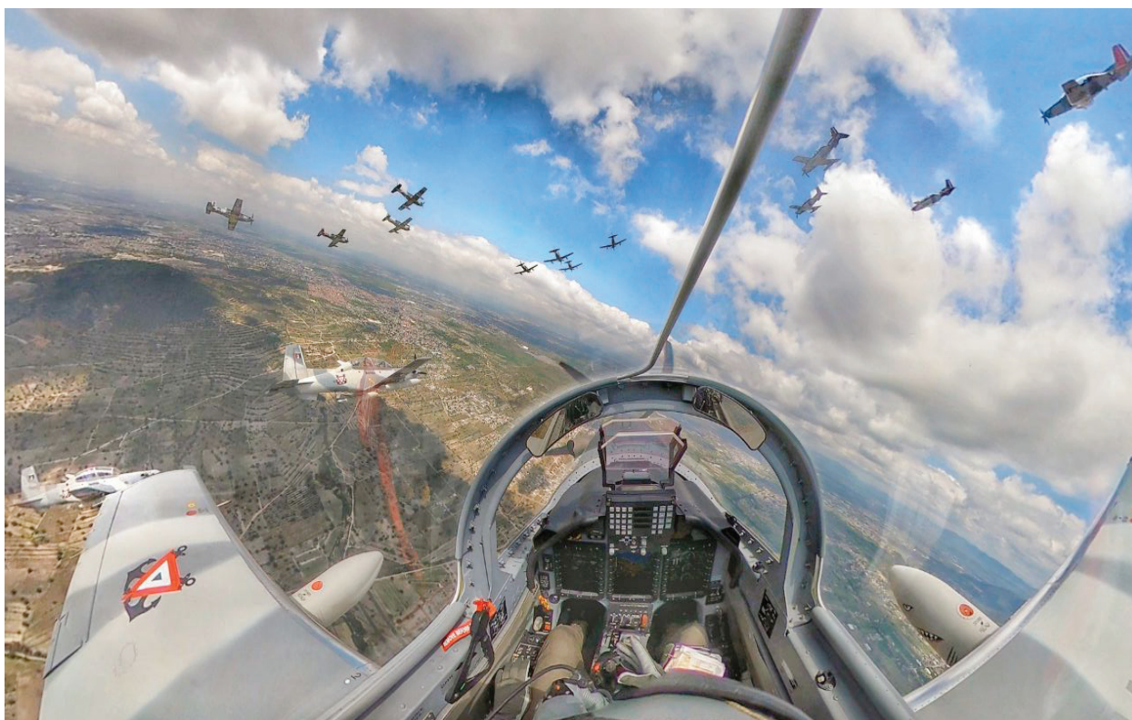
Fotografía 12. Unidad de Aeronáutica Naval.