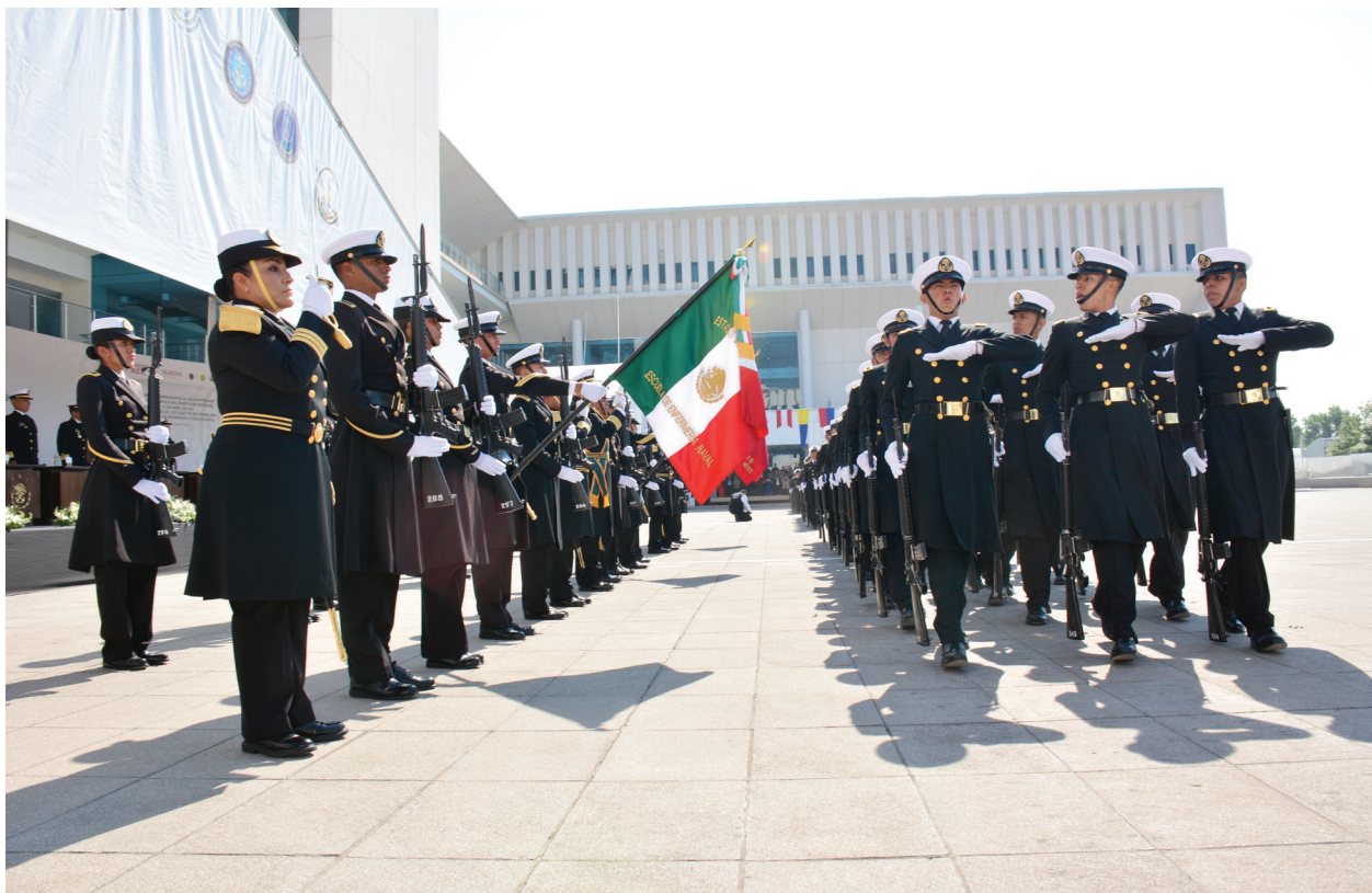
Fotografía 33. Ceremonia de Jura de Bandera.