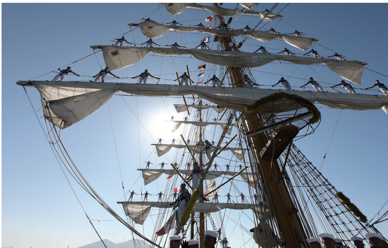
Fotografía 9. Cruceros de Instrucción.

La EMCOGCIBER, tiene como misión determinar y conducir la gobernanza del ciberespacio para