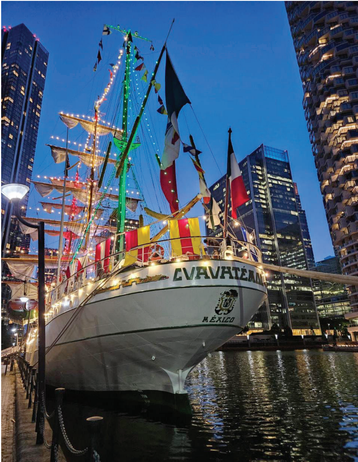
Fotografía 31. Buque Escuela "CUAUHTÉMOC" (BE-01).