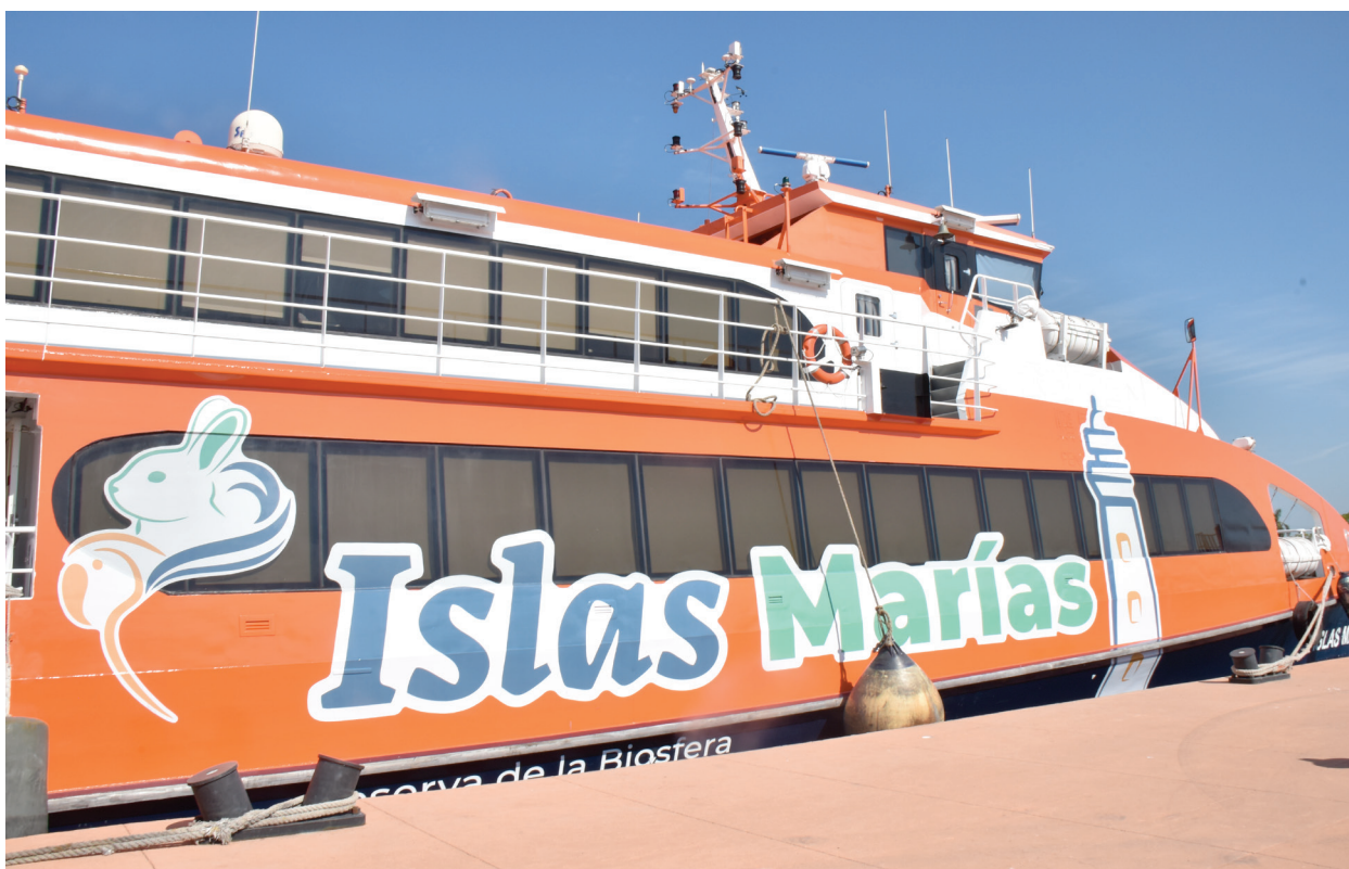
Fotografía 26. Buque Ferry Isla María I.

(ADR-01) y ARM "YAVAROS" (ADR-04), a fin de estar en posibilidades de mantener vías navegables en el país.