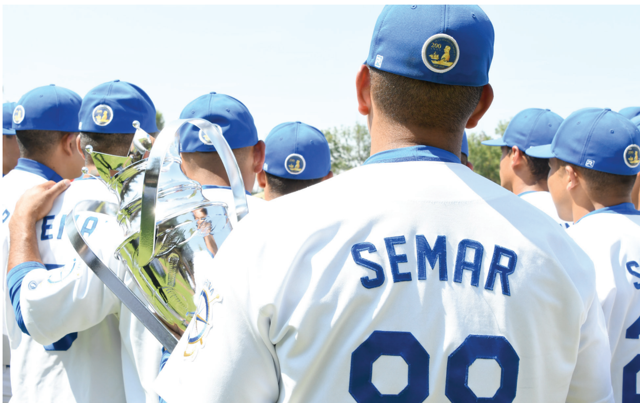
Fotografía 37. Equipo de Beisbol. de MARINA