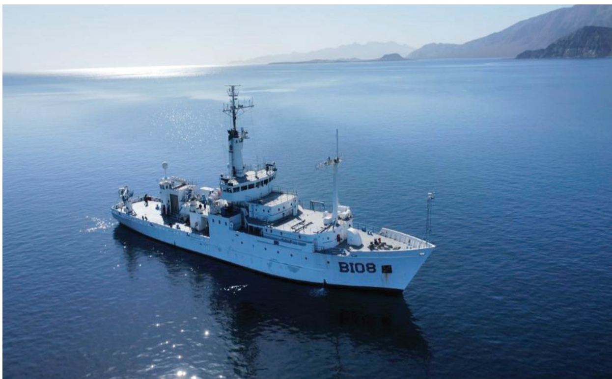
Fotografía 27. Crucero Oceanográfico.

Realiza trabajos hidrográficos en las costas, islas y vías navegables del país y compila información necesaria y adecuada para elaborar y mantener actualizada la cartografía y las publicaciones náuticas nacionales, para su uso y distribución oportuna a fin de garantizar la seguridad a la navegación marítima, contribuir a la salvaguarda de la vida humana en la mar, la protección al medio ambiente marino e impulsar el desarrollo marítimo en el país.