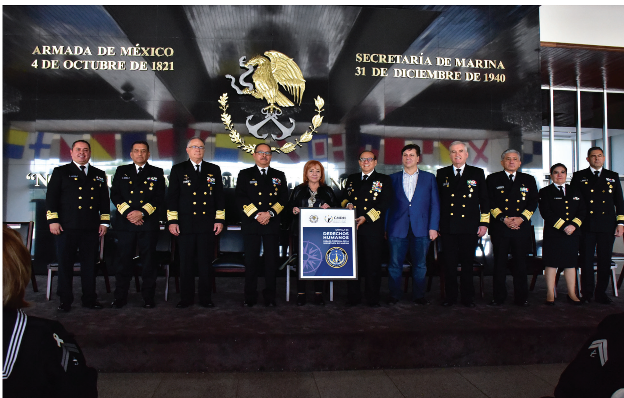
Fotografía 23. Donación de Cartillas de Derechos Humanos.