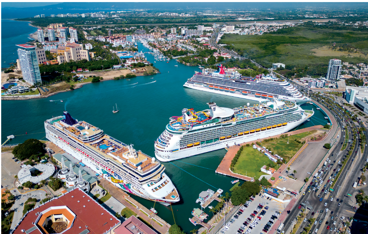
Fotografía 38. Triple arribo de cruceros en Puerto Vallarta.

Esta Dirección Ejecutiva es la unidad integradora encargada de ser el enlace para dar respuesta a