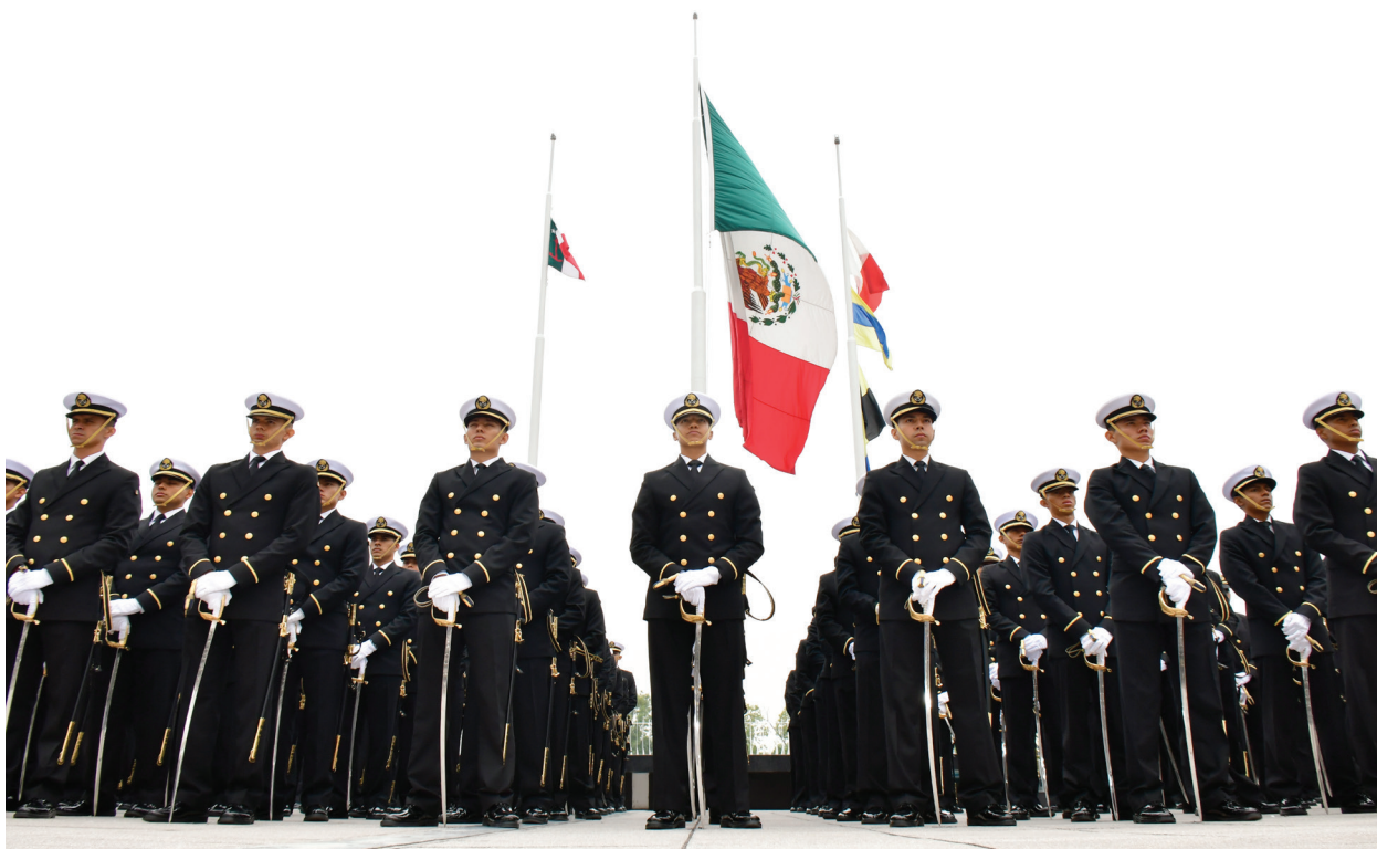
Fotografía 34. Ceremonia de Graduación de las Escuelas Médico Naval y Enfermería Naval.