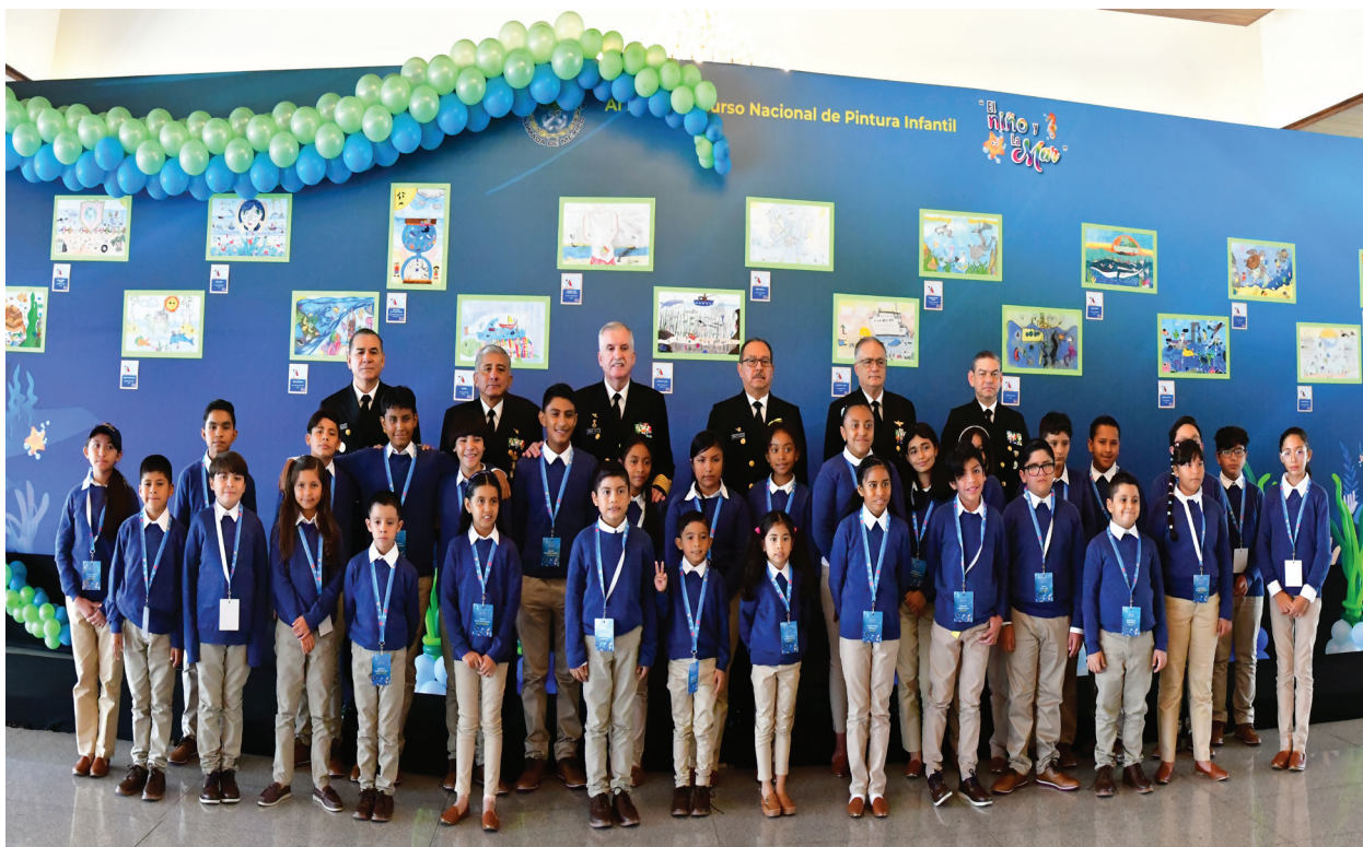
Fotografía 17. XLVI Concurso Nacional de Pintura Infantil "El niño y la Mar".