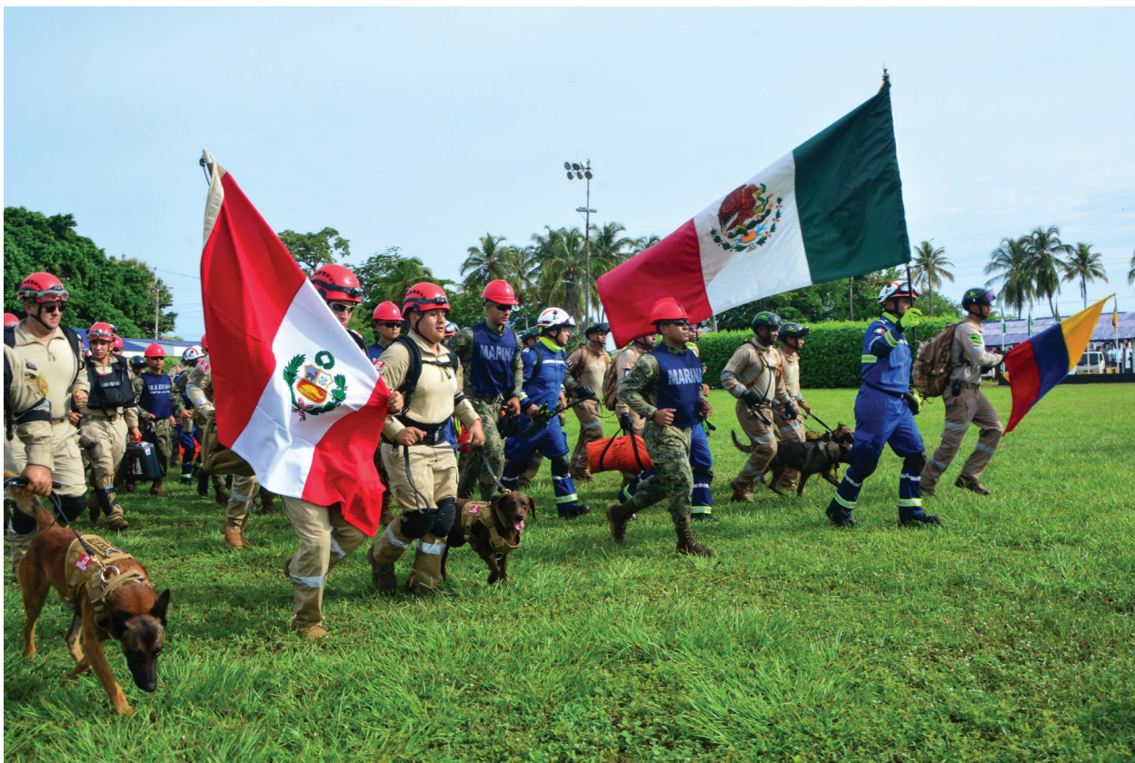
Fotografía 7. Ejercicio Multinacional UNITAS.

amigas, fortaleciendo los lazos de cooperación con los países de la Región de América del Sur.