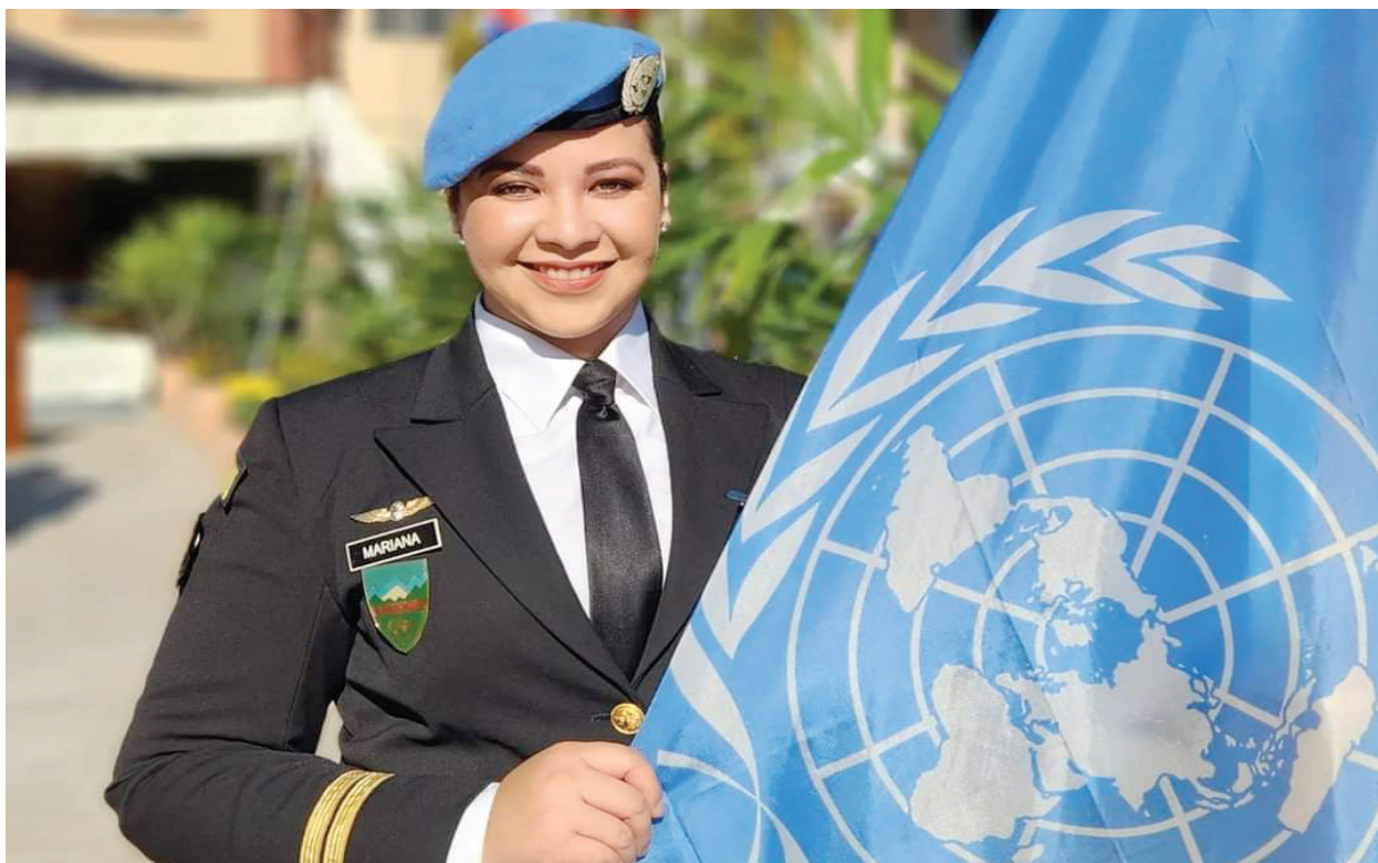
Fotografía 8. Operaciones de Paz

Una parte fundamental en el adiestramiento del personal Naval, lo constituyen los cruceros de instrucción a bordo de diferentes unidades operativas, con la finalidad de poner en práctica los conocimientos adquiridos en las aulas de los Planteles Educativos Navales, se realizó el planeamiento y ejecución del siguiente crucero: