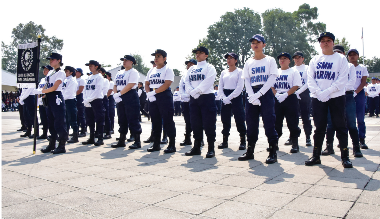
Fotografía 6. Servicio Militar Nacional.