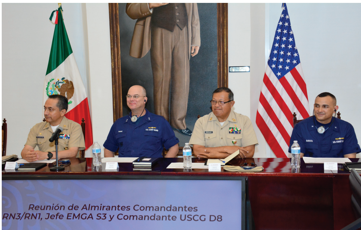
Fotografía 1. Actividades de Coordinación y Cooperación Internacional.

La MARINA, continúa brindando seguridad mediante vigilancia y patrullaje permanente en 130 instalaciones de empresas productivas del Estado, de las cuales; 114 pertenecen a Petróleos Mexicanos, 11 a la Comisión Federal de Electricidad, tres al Banco