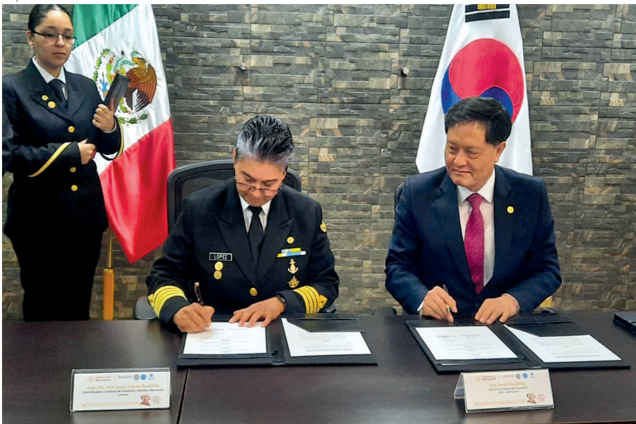
Fotografía 40. Firma del Memorándum de Entendimiento sobre Cooperación técnica entre SEMAR y KIMF.

La Dirección General de Puertos propicia el desarrollo estratégico y armónico de los puertos y litorales mexicanos, mediante la instrumentación de políticas y programas para atender eficientemente las necesidades de transferencia de bienes y transbordo de personas entre los modos de transporte que enlaza. Impulsa el desarrollo de los puertos a través del establecimiento de la política portuaria, tramita concesiones y permisos en los puertos de México; autoriza las reglas de operación, los programas maestros de desarrollo portuario y establece bases de regulación tarifaria y de precios e integra la información estadística, establece la delimitación y determinación de recintos portuarios.