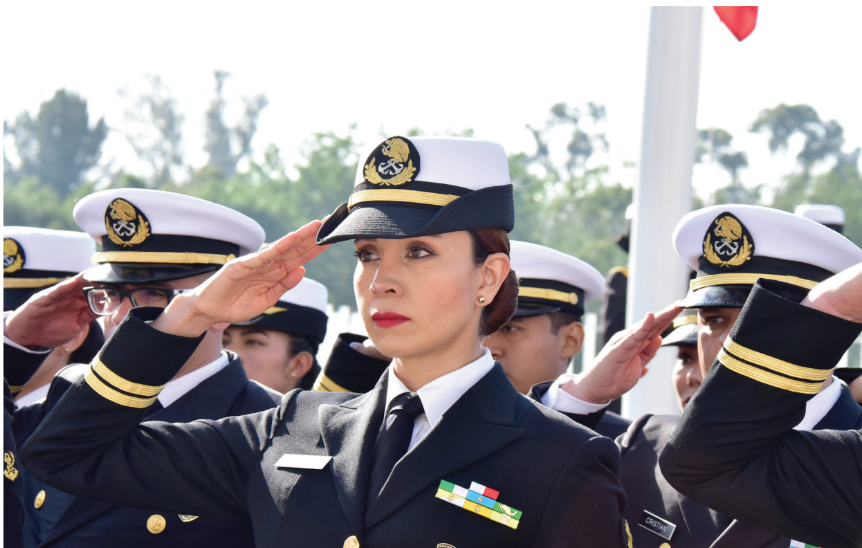
Fotografía 32. Ceremonia de Graduación de Posgrados en Sanidad Naval.

Oficiales de la Secretaría de Marina (30 Mujeres y 28 Hombres); 32 del Centro Médico Naval (CEMENAV), 17 de sedes civiles, dos del Hospital Naval de Especialidades de Veracruz (HOSNAVESVER) y cinco de la Secretaría de la Defensa Nacional (SEDENA), logrando especializar: