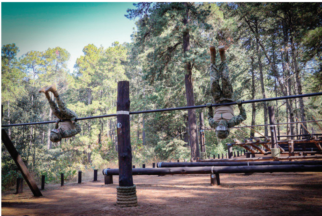
Fotografía 15. Capacitación y Adiestramiento.