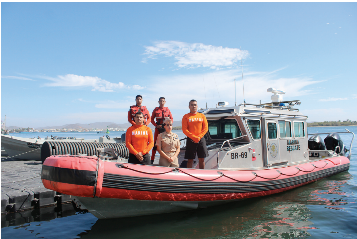
Fotografía 4. Operaciones de Búsqueda y Rescate.