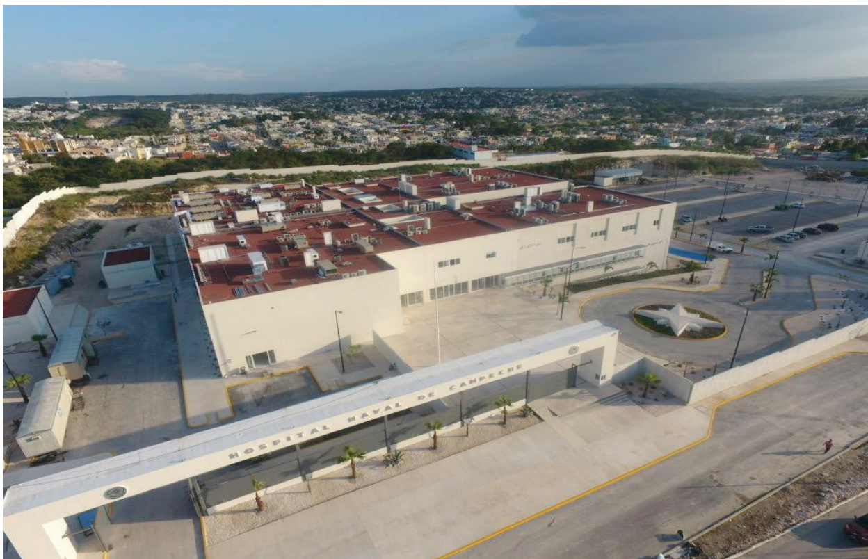
Fotografía 28. Hospital Naval de Campeche.