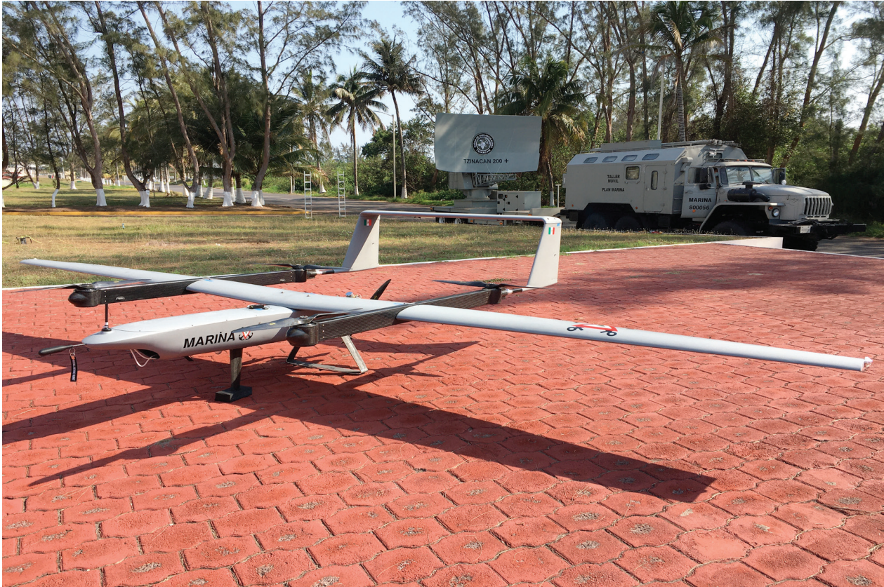
Fotografía 24. Unidad de Desarrollo Tecnológico.