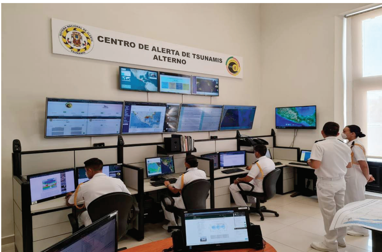
Fotografía 28. Centro de Alerta de Tsunamis.