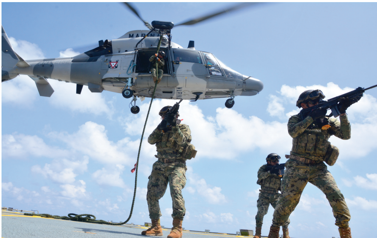
Fotografía 20. Unidad de Operaciones Especiales.

18 secaderos y destruido 17,689 kilogramos de marihuana.