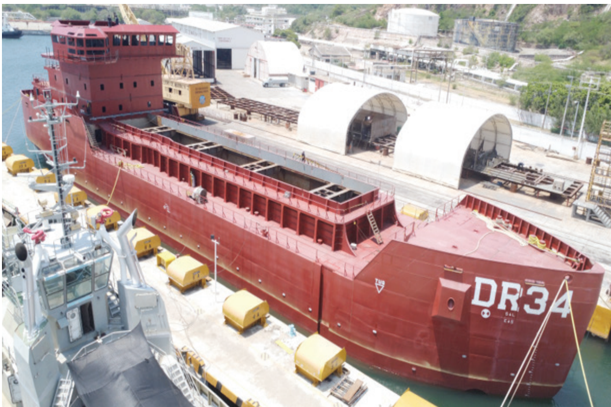
Fotografía 25. Construcción Naval.

En la Dirección General Adjunta de Construcción Naval (DIGACONAV), se continúa con el diseño y