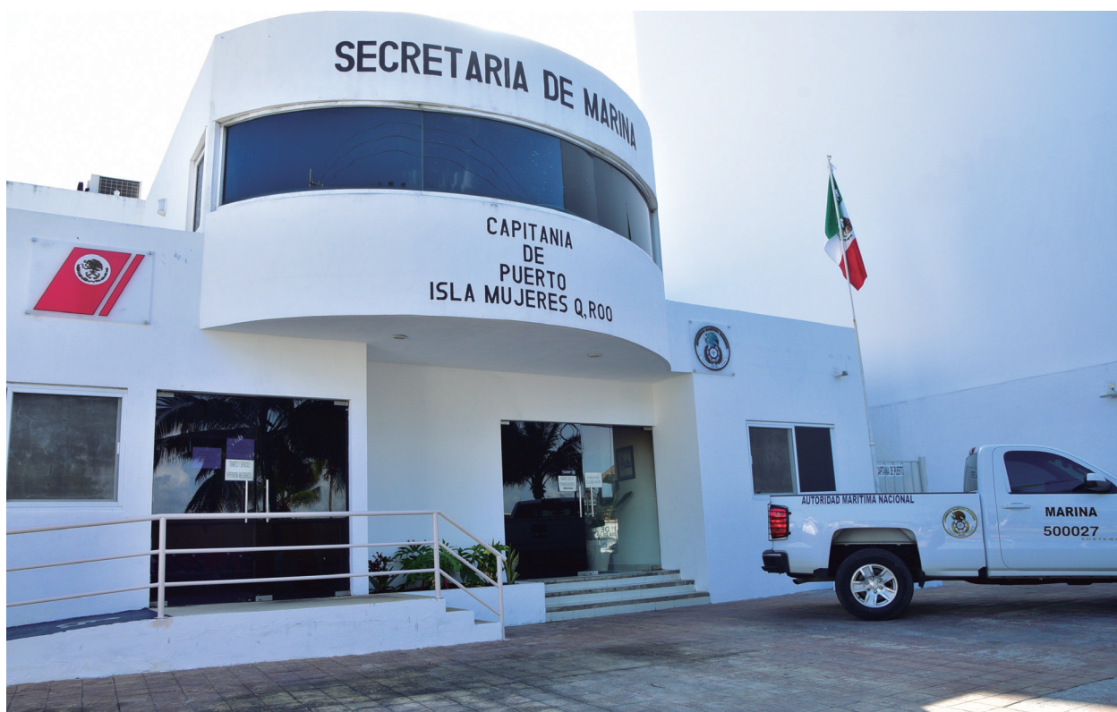
Fotografía 30. Capitanía de Puerto de Quintana Roo.

con información relacionada con la seguridad para la navegación y 422 comunicados de Cierres de Puertos por condiciones invernales, tropicales, mar de fondo, líneas de turbonadas y presencia de fuertes corrientes generados por sismos.