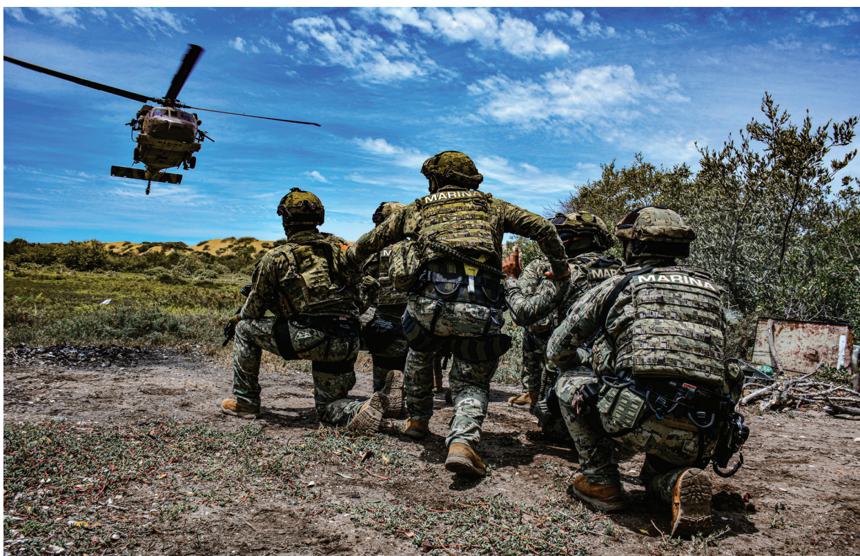
Fotografía 19. Unidad de Operaciones Especiales.