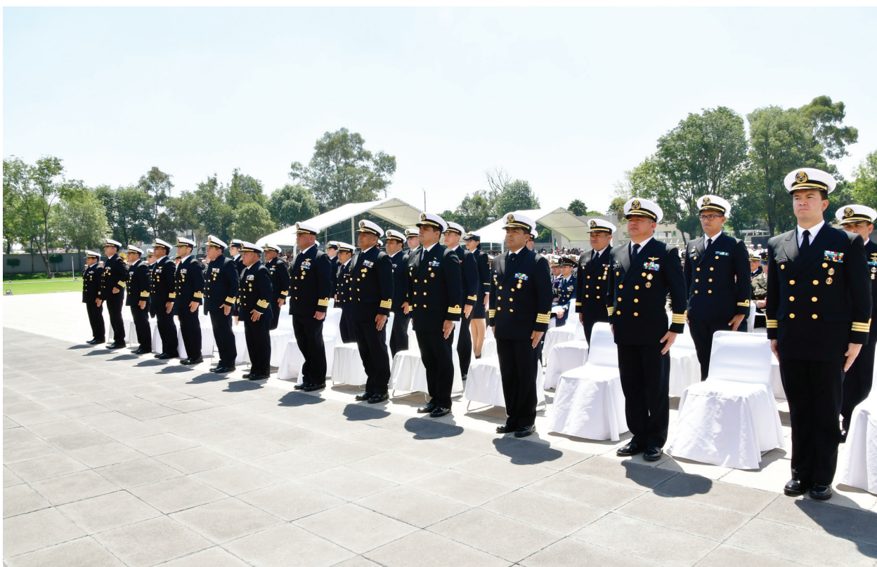
Fotografía 35. Ceremonia de Graduación de Egresados del CESNAV.