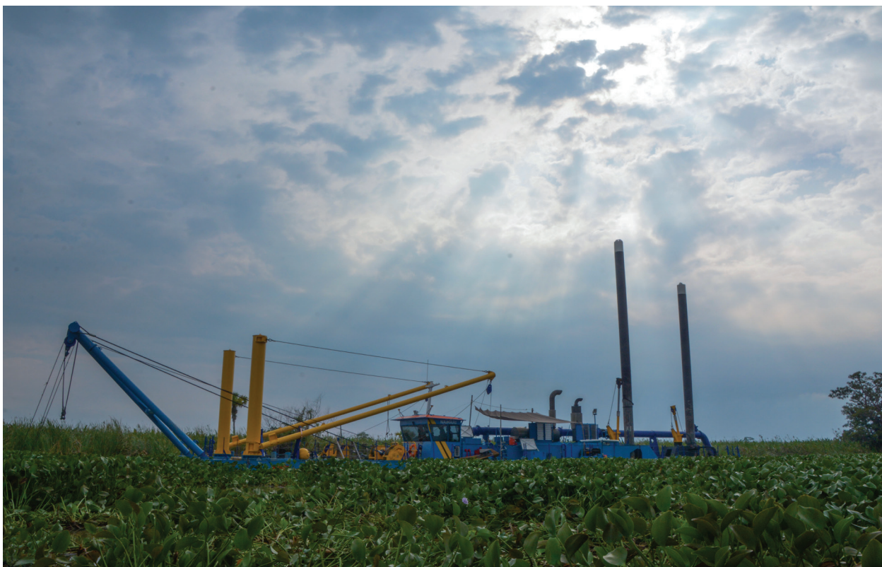
Fotografía 29. Draga.