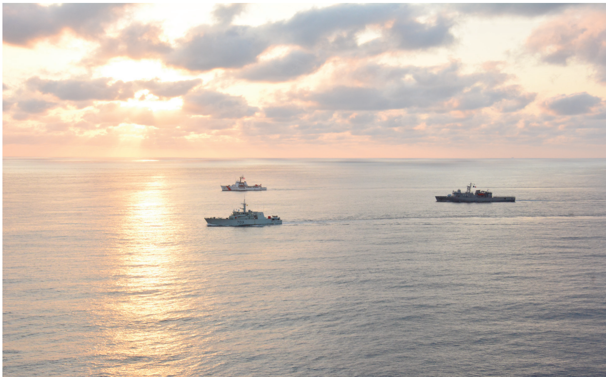
Fotografía 10. Unidades de Superficie.