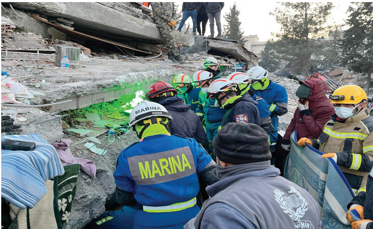
Fotografía 22. Equipo USAR-Marina.

en diversas entidades tales como: Tamaulipas, Quintana Roo, Guerrero, Morelos, Jalisco y Estado de México.