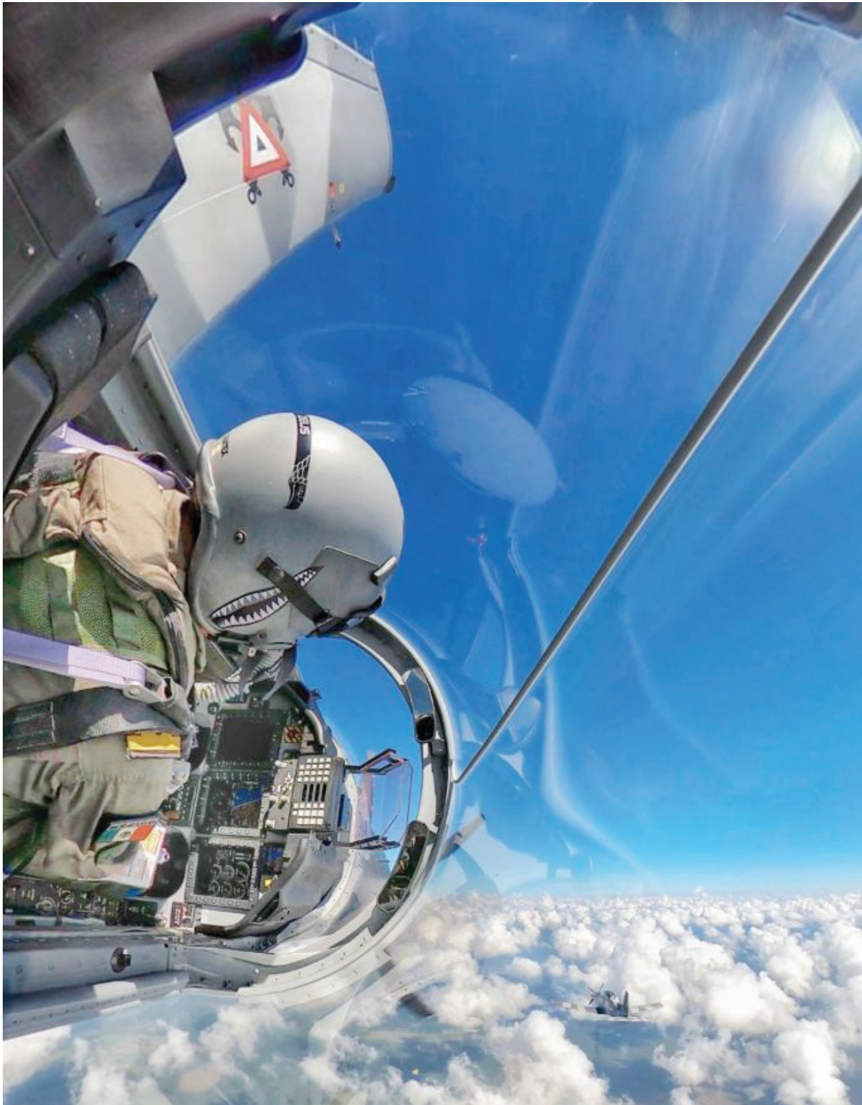
Fotografía 11. Unidad de Aeronáutica Naval.