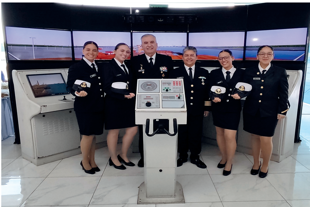
Fotografía 39. "Día Internacional de la Mujer en el Sector Marítimo".

videoconferencias con el Colegio de Marino de Campeche.