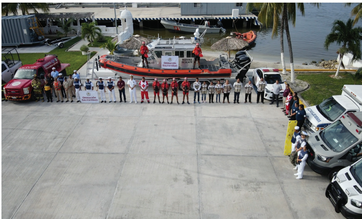
Fotografía 5. Operación Salvavidas Verano 2023.