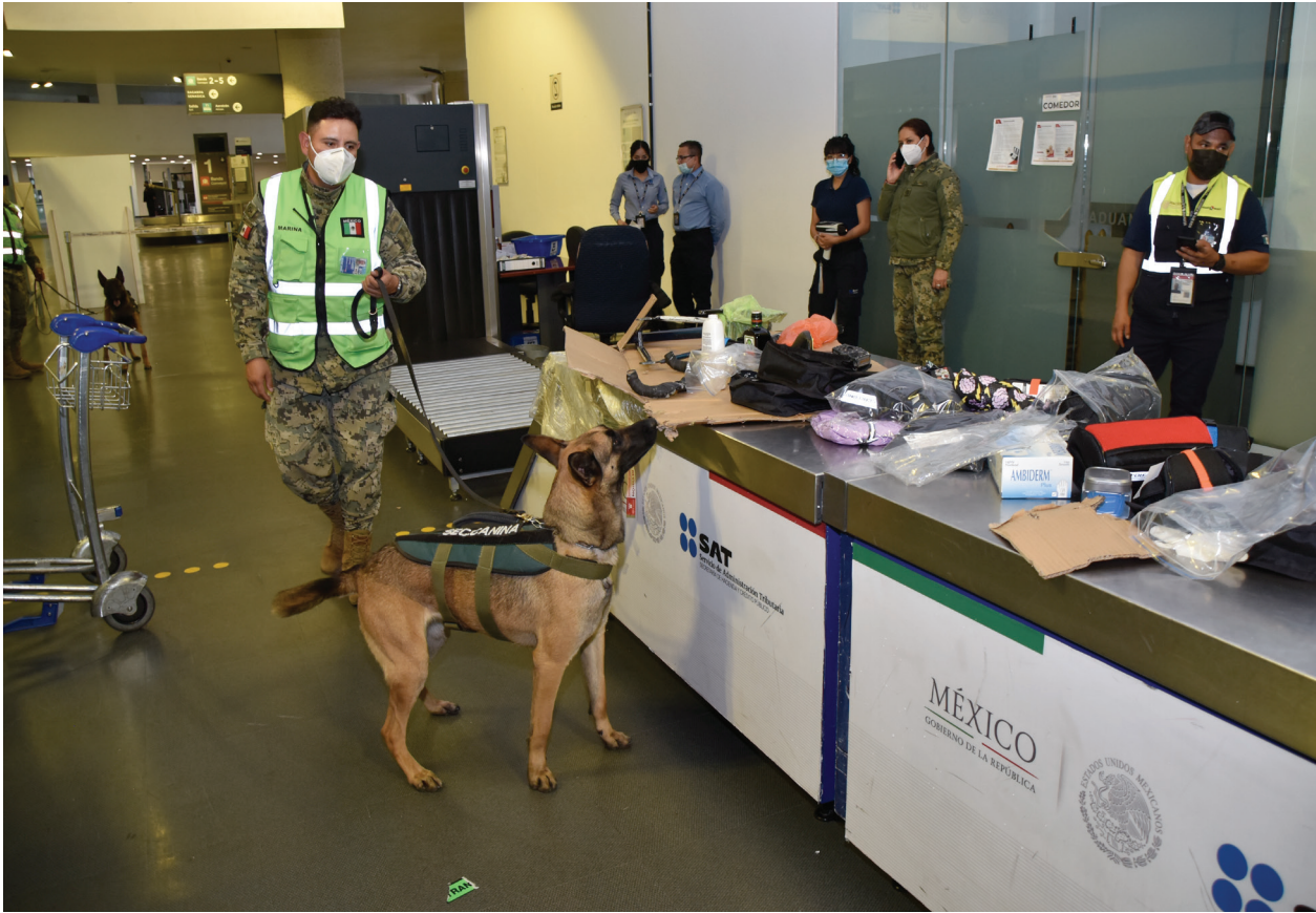
Fotografía 2. Protección Marítima y Portuaria y Aduanas.