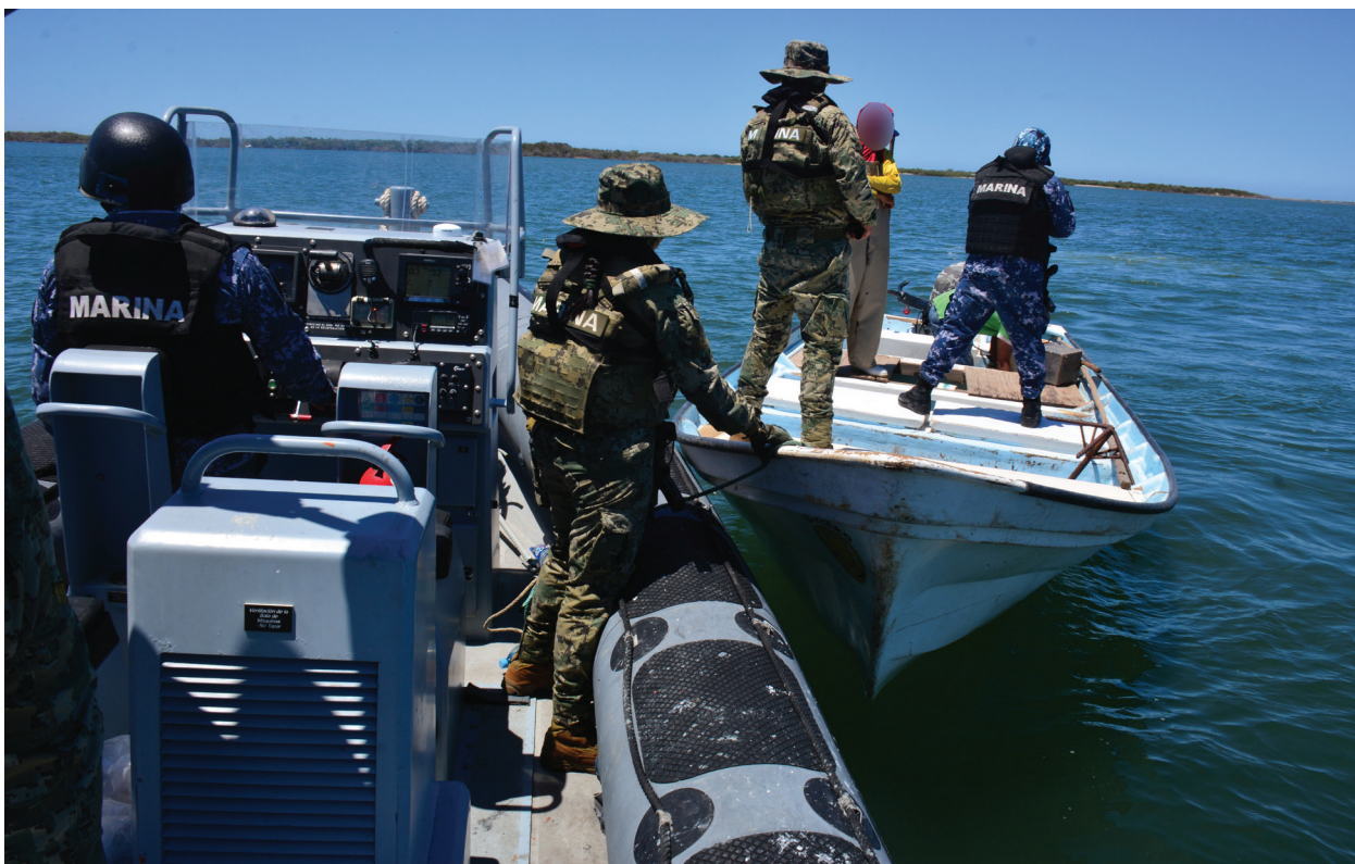
Fotografía 3. Operaciones contra la Pesca Ilegal o Furtiva.