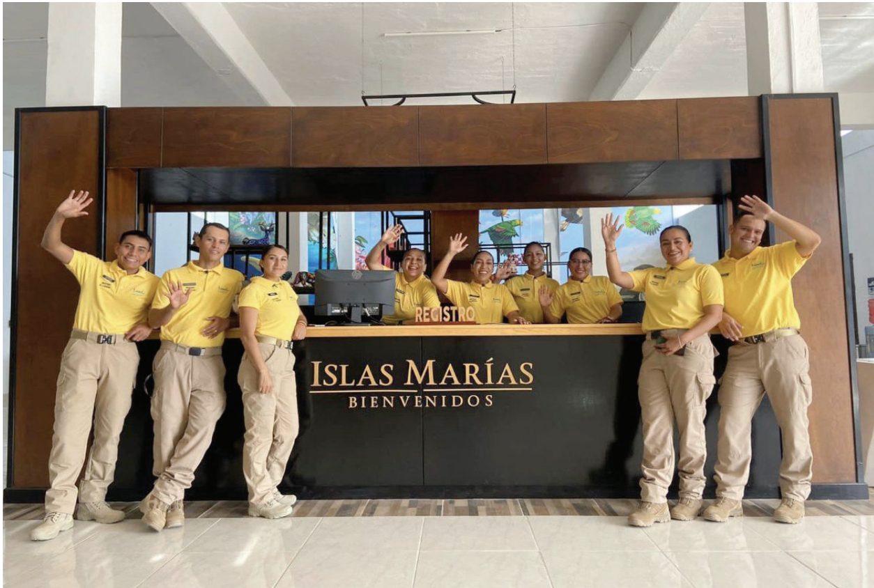
Fotografía 41. Turística Integral Islas Marías.