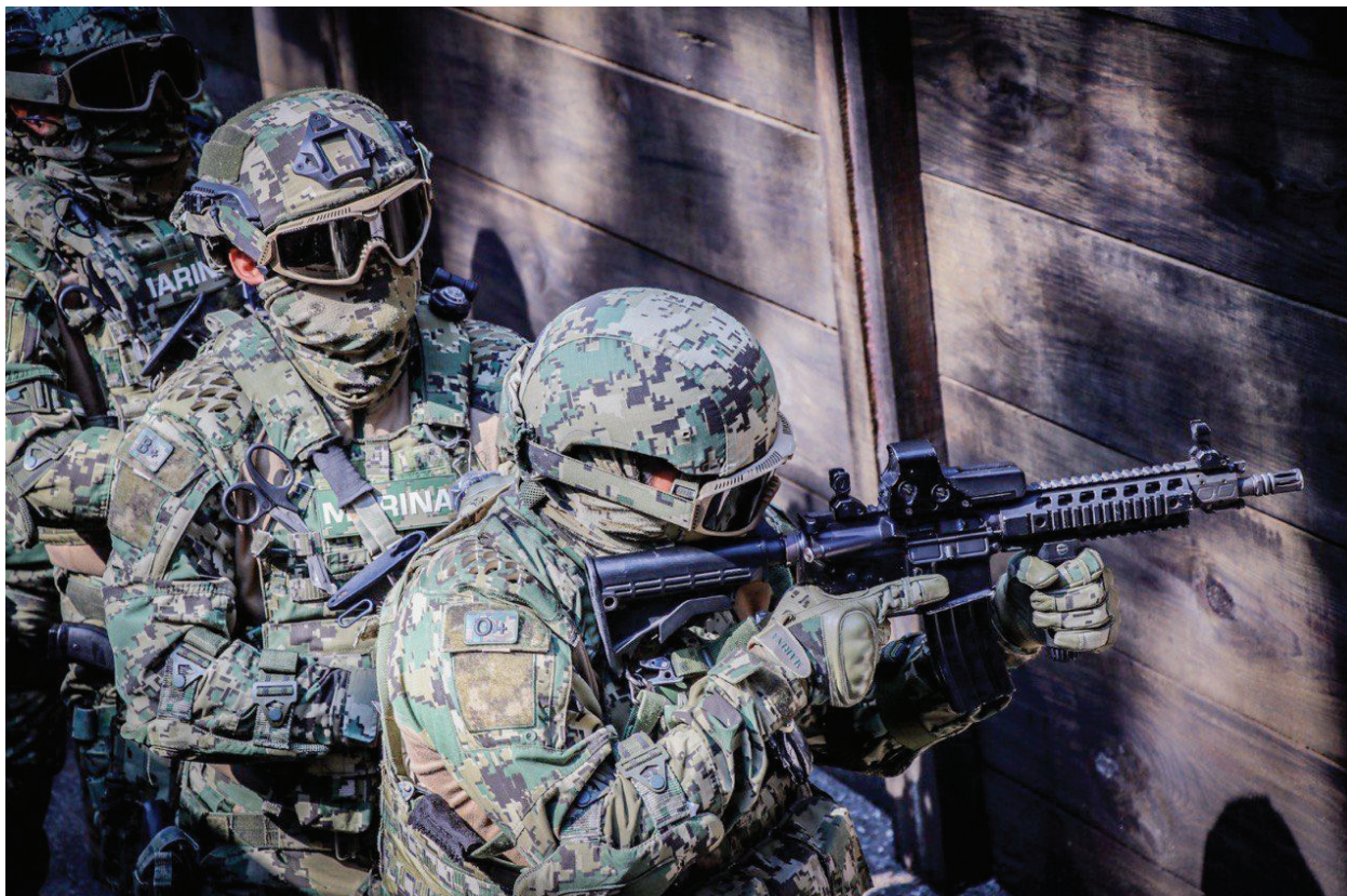
Fotografía 16. Infantería de Marina.