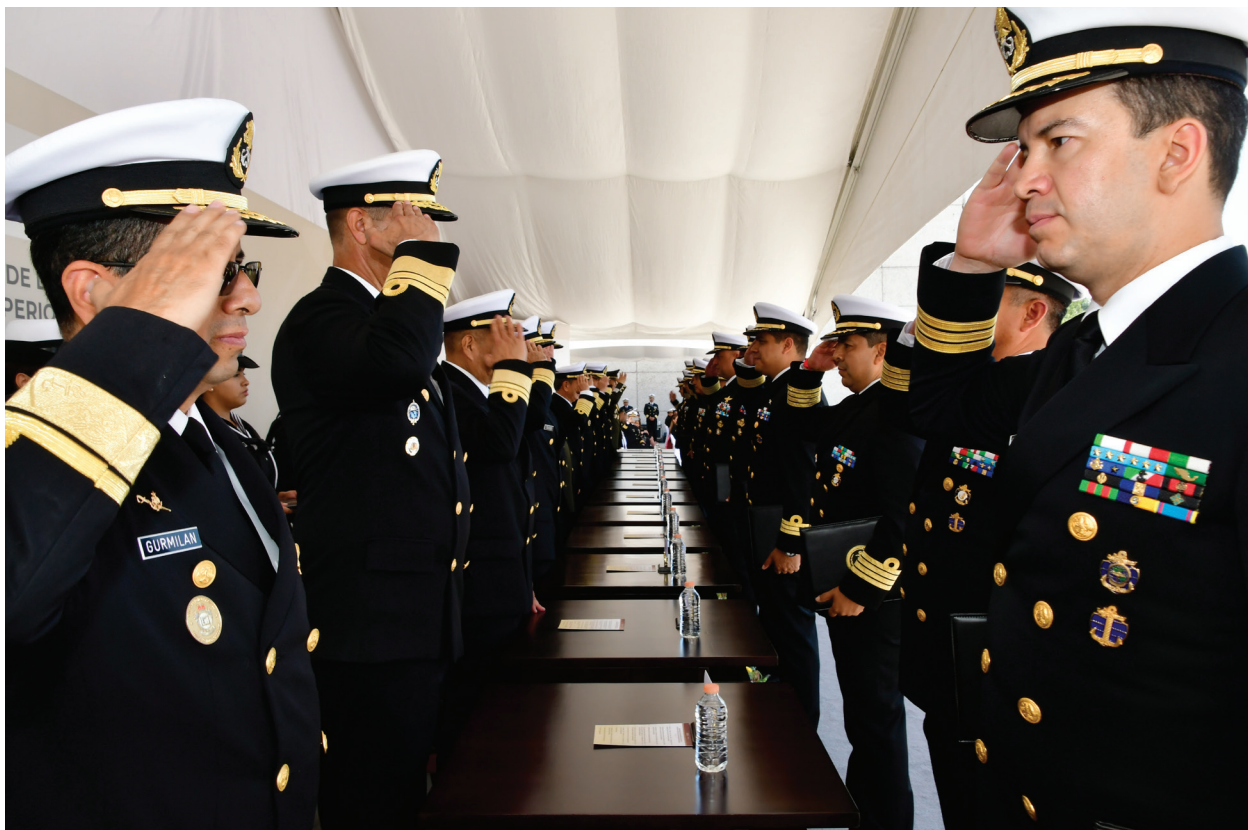
Fotografía 36. Ceremonia de Graduación de Egresados del CESNAV.

La Unidad de Historia y Cultura Naval (UNHICUN), en su importante función de investigar y difundir la historia naval de México, a través de obras bibliográficas, la administración de museos navales y la realización de eventos cívicos, deportivos y musicales; fortalece la relación de la MARINA con la ciudadanía, al promover la creación y consolidación de una conciencia marítima naval.