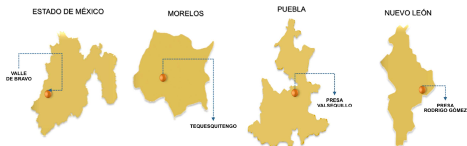
Despliegue de Capitanías de Puerto interiores

La SEMAR mediante la creación de este Programa Presupuestario tendrá presencia permanente en las 104 Capitanías de Puerto, localizadas en los 17 estados costeros del territorio nacional y en los cuatro estados en el interior del país, en los estados de Morelos, Puebla, Nuevo León y el Estado de México, como se muestra en las siguientes figuras.