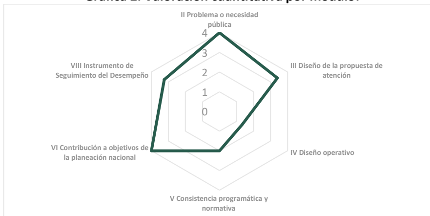
Gráfica 2. Valoración cuantitativa por módulo.

Fuente: elaboración propia con base en las valoraciones de la evaluación y la información proporcionada para hacerla.